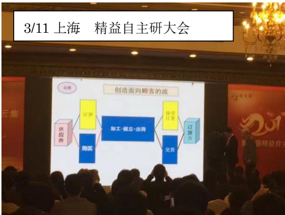
3/11 上海 精益自主研大会