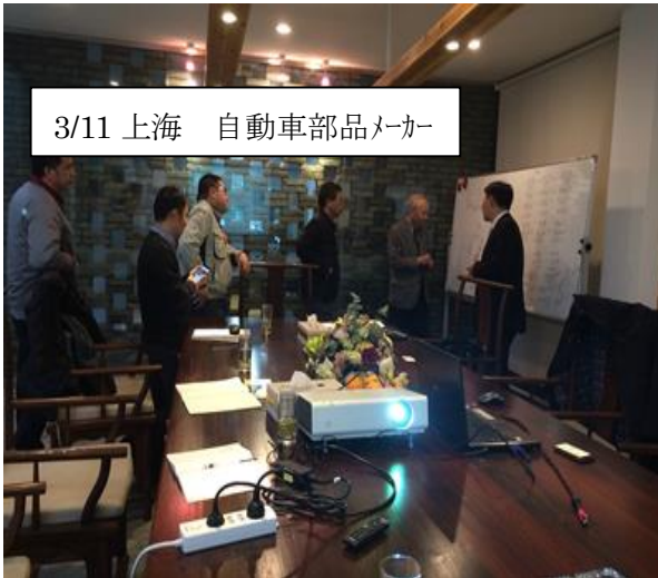
3/11 上海 自動車部品メーカー