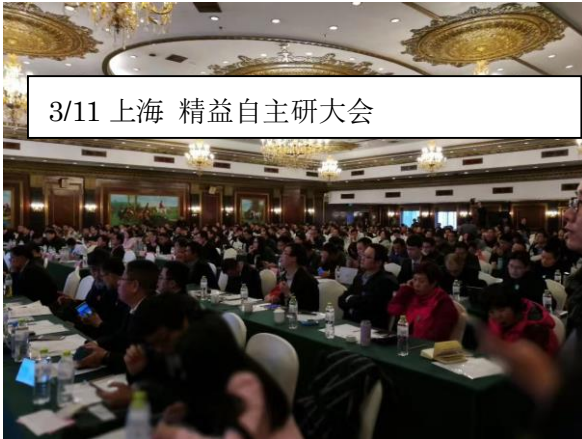
3/11 上海 精益自主研大会